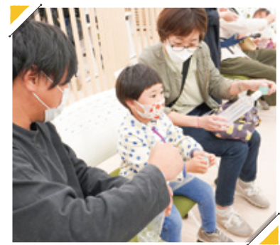
サニーエンジェルスによる「ペットボトルで雲を作ってみよう」会場にて。真剣なまなざし…!