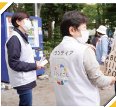
エコルとごしのボランティアメンバーも大活躍の1日!